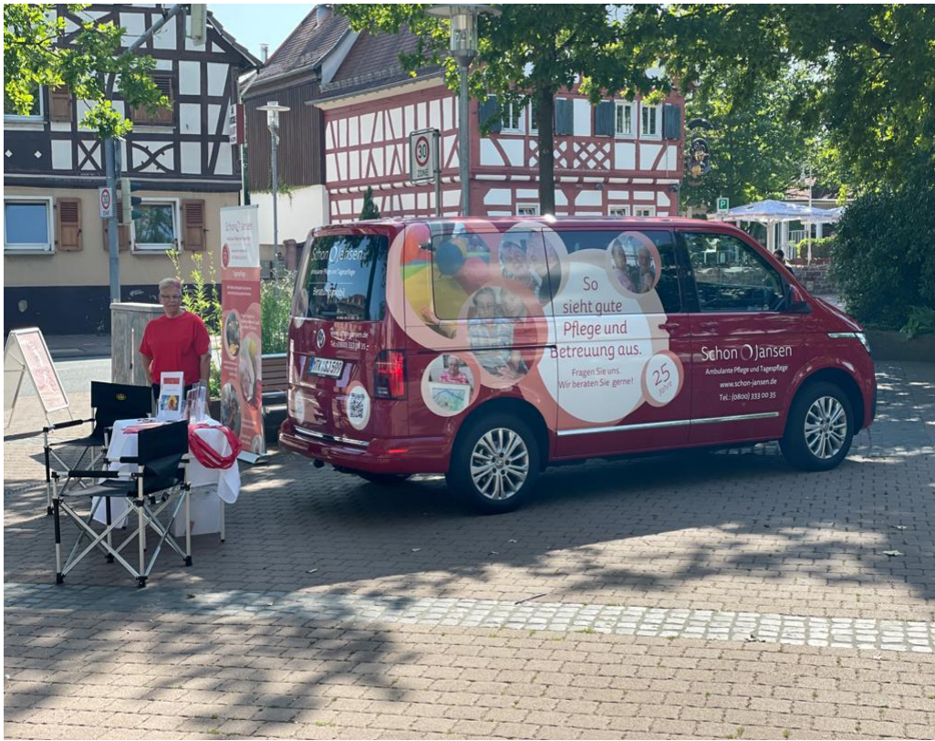
Unser Beratungsbus steht an verschiedenen Standorten